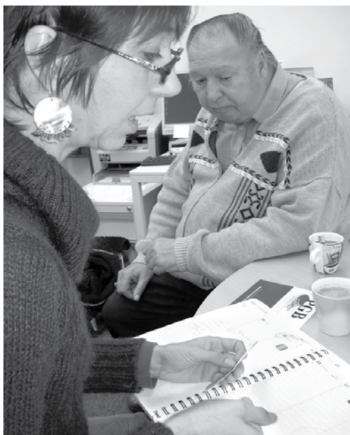
PGB-consulente ondersteunt cliënt bij de aanvraag voor het Persoonsgebonden budget: prestatieveld 3.

De initiatiefgroep wil bezoekers een realistisch beeld geven van psychisch kwetsbare mensen. Dat is nodig, want te vaak kampen zij nog met vooroordelen die voor een groot deel hun maatschappelijke participatie in de weg staan.